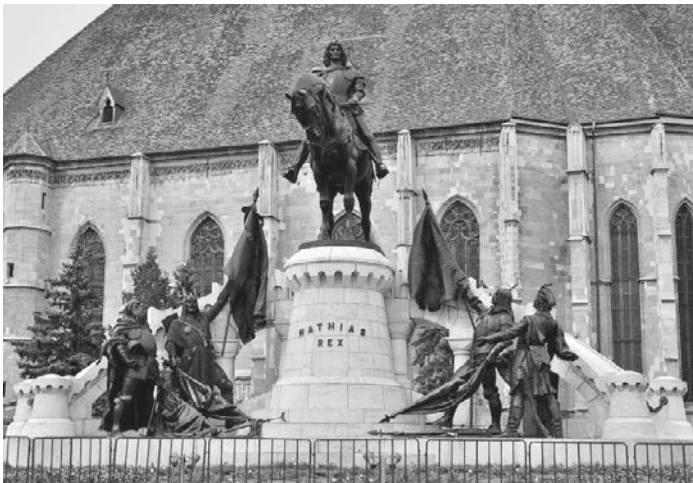
Mátyás király. Kolozsvár.