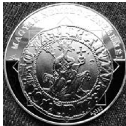
Ezüst 1808-1842.

Elvittek egy órát, egy pisztolyt és egy mellényt is. A kerten át kijutottak a szomszéd gyümölcsösbe és az emelkedőn felmenve a köztetemen keresztül távoztak. A temető szélén, a pénzen megosztottak.