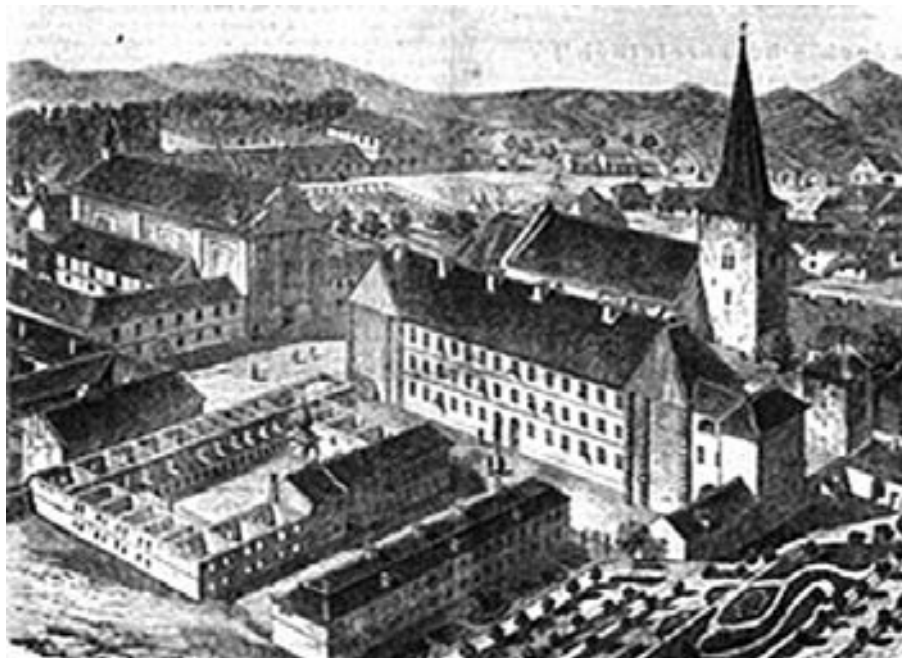
Református Kollégium. Nagynyed. Rajz, 1858.

rövidesen beismerő vallomást tett. Előadta, hogy a rablógyilkosságot három társával együtt követte el.