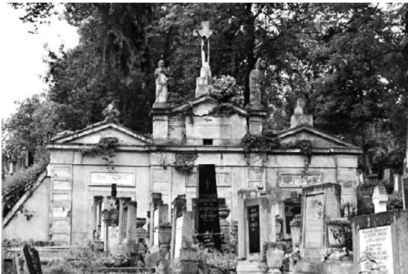
Házsongárdi temető. Kolozsvár.