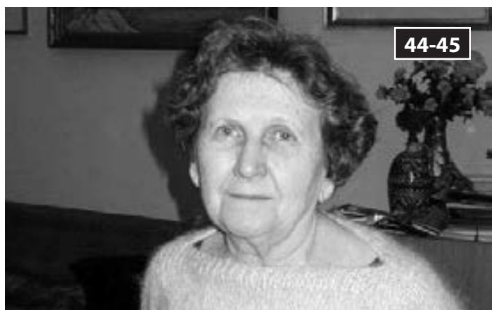
A magyar Agatha Christie