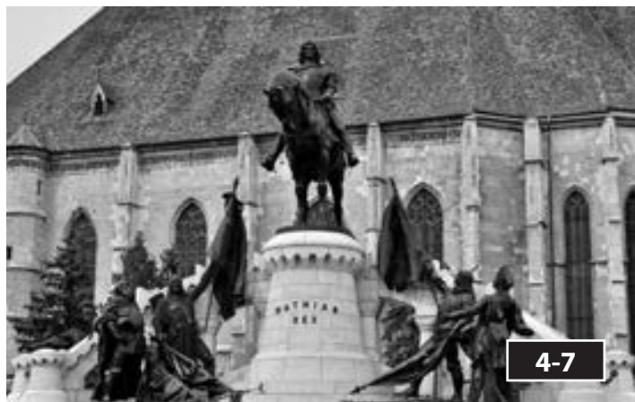
Rablógyilkosság 1835 decemberében