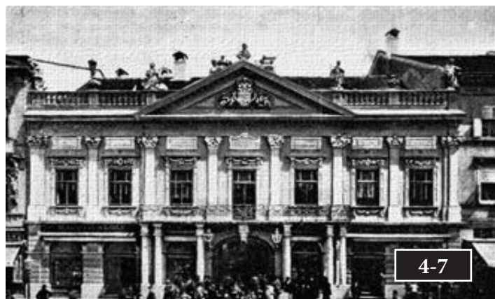
Szilánkok Kassa dualizmuskori rendőrségéről