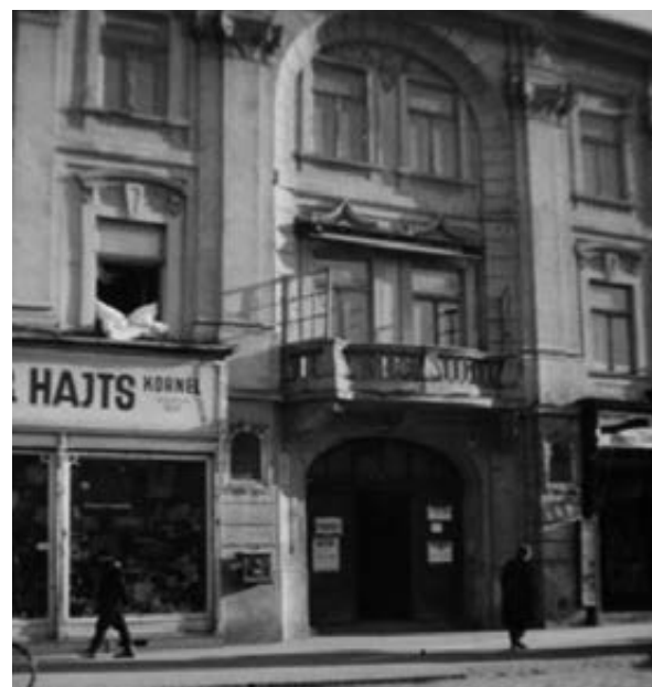
Fekete Sas Fogadó

A végrehajtó rendőrség szervezetét képezi a tiszti személyzet: egy rendőrfelügyelő; az ellenőrző személyzet: öt rendőrbiztos; a rendőri személyzet: egy rendőrorrmester, tíz rendőrellenőr, ötvenhat (56) I. osztályú rendőr, húsz (20) II. osztályú rendőr, nyolc (8) polgári rendőr (detektív), egy rendőrségi foglár. A rendőrfelügyelő, egy rendőrbiztos és