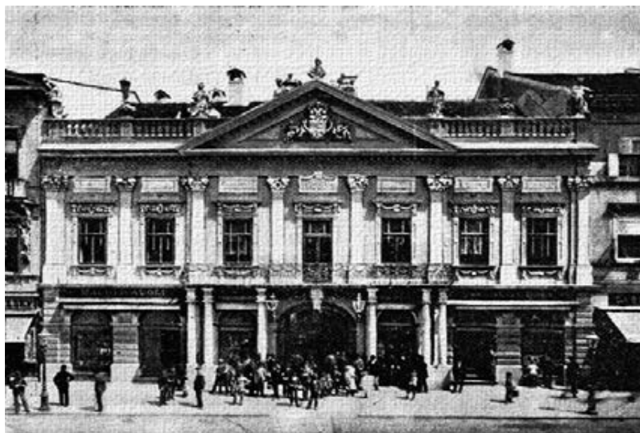
Kassa városháza

A személyi állományt jelentette a főkapitány alárendeltségébe tartozó kettő alkapitány, kettő jegyző, három irodai alkalmazott, öt kapu őrnök, kettő belvárosi rendbiztos, négy külvárosi rendbiztos és három külső rendbiztos. A rendbiztosoknak ismerni kellett a városban használt három nyelvet és állandó lakhellyel kellett rendelkezniük a körzetükben. Az őrszolgálat parancsnoka a rendőrhadnagy volt, akinek a városházán lévő szolgálati lakásban kellett laknia. A rendőrök felügyelete mellett feladata volt biztosítani a városháza rendjét és tisztaságát is. Beosztottjai közé tartozott kettő őrmester, 45 rendőr és a városi dobos, mely állás 1883-ig élt. A rendőröket lehetőség szerint három nyelven beszélő, írástudó volt nyugdíjas katonák közül választották ki, előnyben részesítve a kassai születésűeket vagy a városban már szolgálatot teljesítőket.