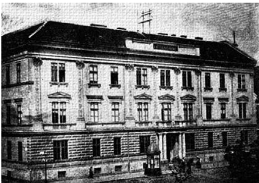
Kassa törvényszék

Közben egyesült Pest, Buda, Óbuda és a Margit sziget Budapestté (1872. évi XXXVI. törvénycikk) egyben megtörtént a fővárosi rendőrség államosítása és megindult a küzdelem a vidéki rendőrség(-ek) államosításáért is.